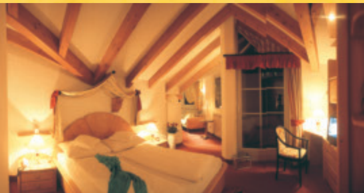
Turmsuite · Suite La Torre