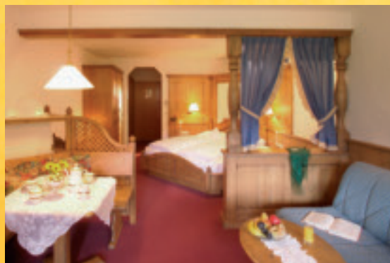
Juniorsuite • Suite Junior